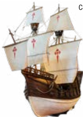
Model de la Nau Santa Maria de la Victoria (segle XVI). Va ser la primera en completar la volta al món.

Set històries narrades per set personatges a bord de set vaixells que expliquen qüestions universals com el descobriment de nous territoris, el mar com a espai de lleure, la vida a bord d'un transatlàntic, el mar com a escenari de conflictes, la mercaderia, la pirateria i el cors, i el canvi tecnològic. Un viatge per la història de la navegació moderna i contemporània.