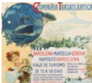
Cartell publicitari de la Compañía Transatlántica (Ruiz, 1910).