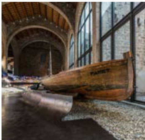
Barca de pesca Papet (segle XX), hereva de la tradició constructiva medieval.