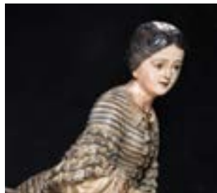
Mascaró de proa La Blanca Aurora (Lloret de Mar, 1848).