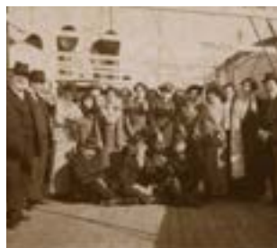
Retrat d'un grup de passatgers a la coberta d'un transatlàntic (1910).