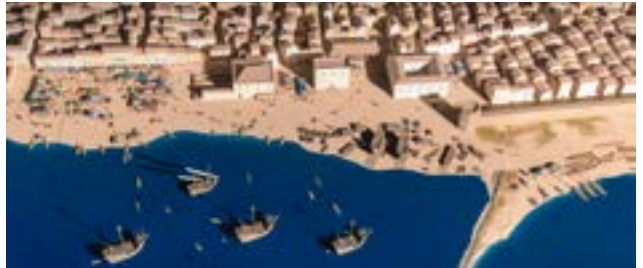
La façana marítima de Barcelona al segle XV.