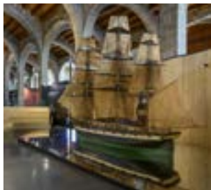
Fragata Barcelona . Model d'ensenyament (Escola de Nàutica de Barcelona, segle XIX).