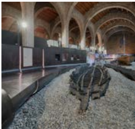
Recreació de l'entorn natural on es van localitzar les restes de Les Sorres X .

Les Sorres X és una petita embarcació de la segona meitat del segle XIV destinada al transport de mercaderies. És una de les poques barques medievals que es conserven a la Mediterrània. Per això és una oportunitat única per a l'estudi i la divulgació de la navegació de cabotatge de l'època.