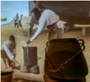
Els oficis tradicionals de mar.