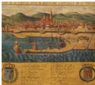
Barcelona abans del desenvolupament del comerç amb Amèrica (segle XVII).

Exposició que relata l'evolució de la navegació marítima catalana, des del comerç per la Mediterrània fins al comerç transatlàntic, així com el pas de la vela al vapor. Tres segles en els que la marina catalana s'obre econòmicament i socialment a nous mons.