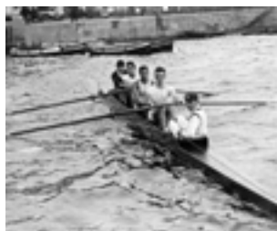
Outrigger a 4. Campionat d'Espanya (Barcelona, cap al 1924).