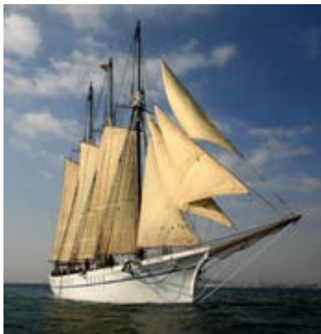
Pailebot Santa Eulàlia

El Museu Marítim de Barcelona (MMB) va néixer l'any 1936 i és un equipament públic dedicat a la divulgació de la cultura marítima i, en especial, a la conservació, preservació i difusió del patrimoni cultural marítim de Catalunya. L'MMB es troba molt arrelat a la ciutat de Barcelona, tant per la seva pròpia història com per l'edifici que l'acull: el conjunt monumental de les Drassanes Reials de Barcelona.