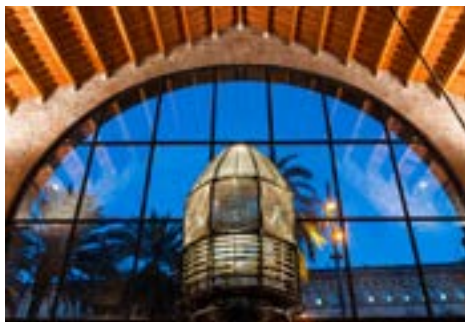
Òptica del Far de Sant Sebastià

El conjunt monumental de les Drassanes Reials de Barcelona té més de set segles d'història. Va ser construït al segle XIII per a la fabricació i manteniment de galeres i vaixells de guerra al servei del rei d'Aragó Pere el Gran. És un dels edificis del gòtic civil més importants del món.