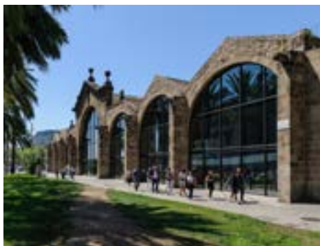
Façana de les Drassanes Reials

És un veler de més de cent anys que forma part del patrimoni a l'aigua del Museu, i que permet comprendre la història de la navegació i el comerç marítim al nostre país. Pel seu valor patrimonial i històric, l'any 2011 va ser declarat Bé Cultural d'Interès Nacional. El Santa Eulàlia és amarrat al Moll de Bosch i Alsina, molt a prop del Museu Marítim. Es pot visitar diàriament. Els dissabtes al matí surt a navegar pel front marítim de Barcelona, excepte quan participa en esdeveniments nàutics tradicionals.