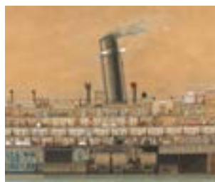
Dibuix longitudinal del Reina Victòria Eugènia . Cia Trasatlàntica Española (1912).