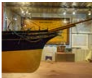
Model del vapor City of Paris (1888). Un exemple de la transició de la vela al vapor i de la fusta a l'acer.