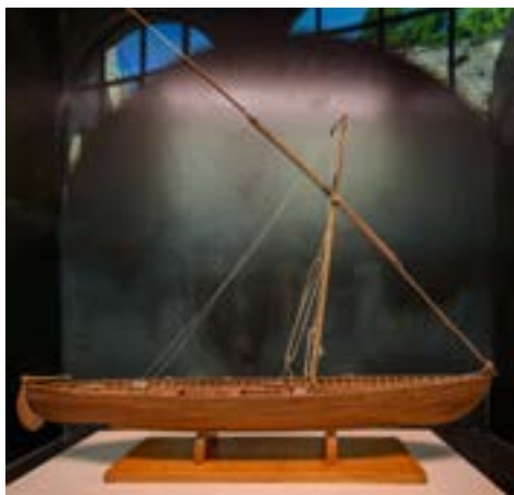
Reconstrucció hipotètica de la barca Les Sorres X a partir de les restes conservades.